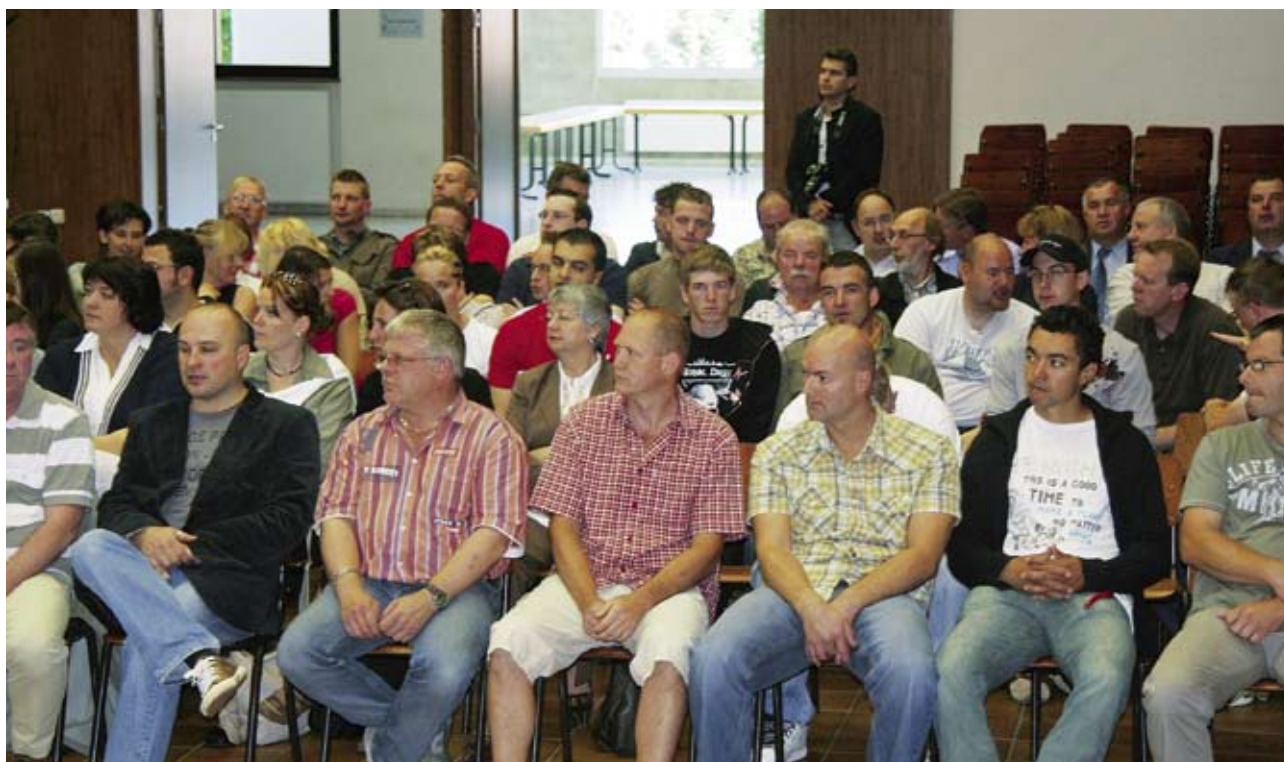
Auf Einladung der Gleichstellungsbeauftragten der Gemeinde Luxemburg, fand am 4. Juli 2008 im Kulturzentrum in Cessingen eine Konferenz für das Personal der Gemeinde statt.