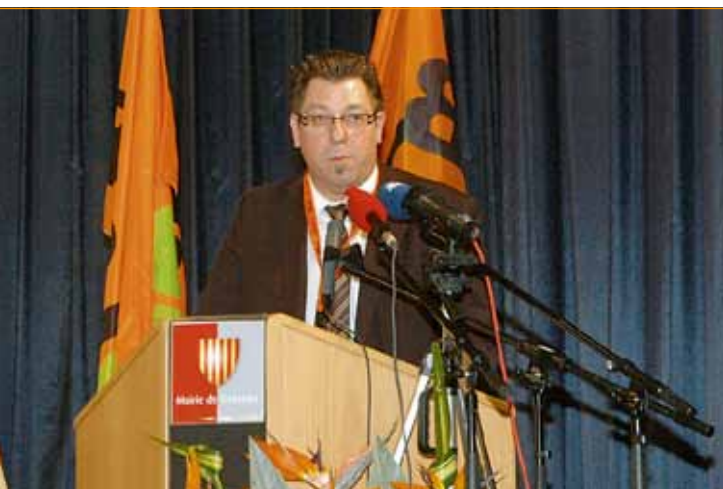
Initiativantrag: Die integrale Wiedereinführung der automatischen Indexanpassungen (LCGB-Bezirk Süden – Fränk Rippinger)