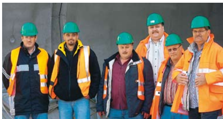
Die LCGB-Betriebssektion Ponts et Chaussées besichtigte am 14. September 2007 den „Tunnel Grouft“ in Lorentzweiler. Dieser Tunnel ist ein Element der im Bau befindlichen „Nordstrooss“.